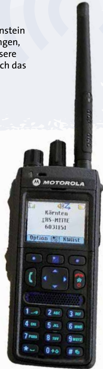
Derzeit läuft beim Digitalfunk eine Testphase in drei Ortsstellen.

Sobald die Zustimmung vorliegt und die Testphase abgeschlossen ist, steht einer breiten Einführung des Digitalfunks bei der Bergrettung Kärnten nichts mehr im Wege. Dennoch bleibt die Versorgung alpiner und abgelegener Regionen eine Herausforderung. Nur ein konsequenter Netzausbau wird sicherstellen können, dass der Digitalfunk auch dort zuverlässig funktioniert, wo er am dringendsten gebraucht wird. Der Digitalfunk ist ein bedeutender Fortschritt für unsere Einsatzkommunikation. Er bringt mehr Effizienz, mehr Sicherheit und eine bessere Unterstützung, doch sein volles Potenzial wird er erst dann entfalten, wenn auch die Infrastruktur entsprechend angepasst ist. ❌