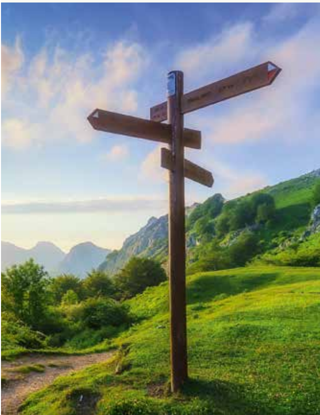
Wenn sich die Spur verliert.

des Nassfeldes durch italienische Kräfte ausweiten. Auch dort stiegen Hubschrauber auf und Bodenkraften suchten jeden Steig und das Gelände ab. Nachdem die erste Suche erfolglos geblieben war, bildeten wir sogenannte Suchketten und bewegten uns im zum Teil unwegsamen Gelände. Spezielle Hunde, denen ein getragenes Kleidungsstück der Abgänger zur Witterungsaufnahme vorgelegt wurde, kamen sogar aus Südtirol. Weiters kamen Berufstaucher und suchten den Nassfeld-See und sämtliche Speicherteiche am Berg ab. So wurde Tag für Tag das Suchgebiet erweitert, bis der Einsatz schließlich ohne Ergebnis von der Behörde eingestellt werden musste. Bis heute gibt es keine Spur der zwei Abgänger.