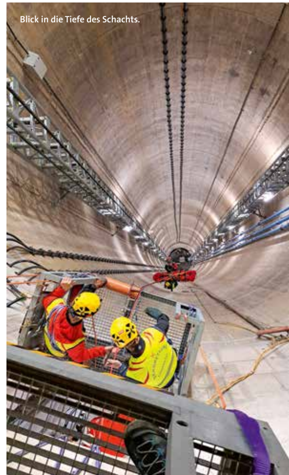
Blick in die Tiefe des Schachts.

Erst dann übernehmen die Winden der Feuerwehr. Aufgrund der Höhe wurde drei Mal umgebaut, sprich, das Stahlseil der Feuerwehrwinde am Gang neu ausgelegt, bis der Ausstieg erreicht wurde. Ab hier übernahm wieder die Mannschaft an der Faserseilwinde. Die gemachten Einsatzerfahrungen – Abseilen des Retters (Dauer ca. acht Minuten), Aufseilen des Retters mit zwei Verunglückten (Dauer ca. 20 Minuten) – flossen ebenso in die finale Version des Einsatzplanes ein wie auch erkannte Verbesserungen des Systems. Alle Beteiligten, nämlich Bergrettung, Feuerwehr und ÖBB, konnten diese Einsatzübung mit einem sehr positiven Gefühl beenden. ❌